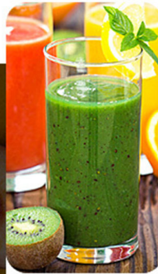
Jugo de frutas