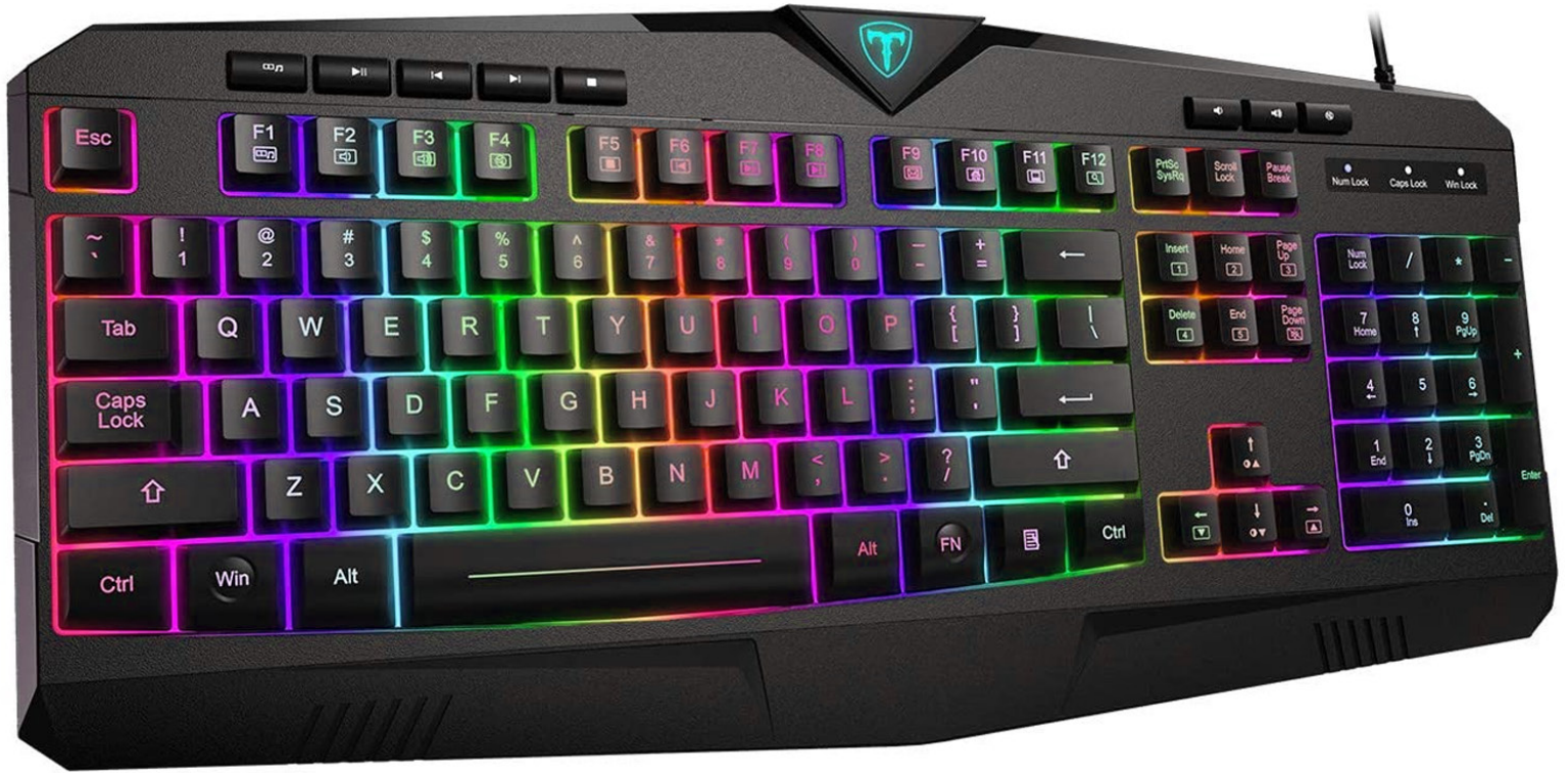
Teclado RGB para juegos Teclado con cable USB