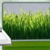
Hierba de trigo